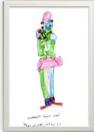
ولاء عبد الودود برهام ١٠ سنوات شكل رقم ( ١٤ )