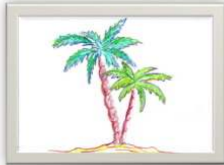
وسيط رقم ( ٣ )

نماذج لبعض الوسائط المرسومة والمصورة التي قدمها الباحث للطلاب المستهدفين