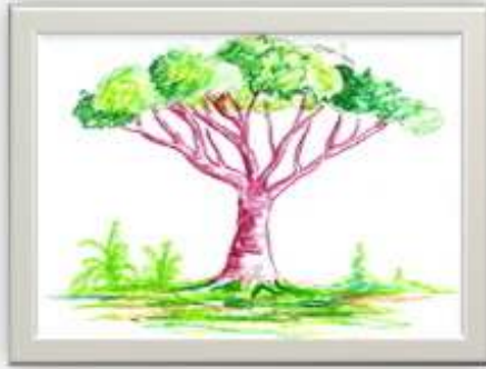
وسيط رقم ( ٤ )