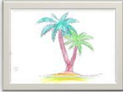
ماهيئاب القيعي ٧ سنوات شكل رقم ( ١٤ )