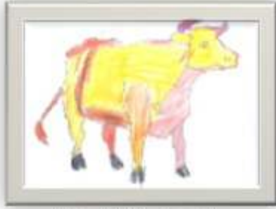
سالي جمال علوان ٧ سنوات شكل رقم ( ١٠ )