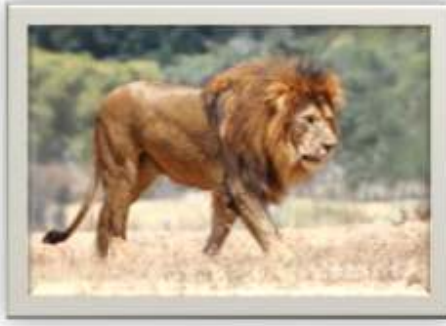
وسيط رقم ( ٨ )