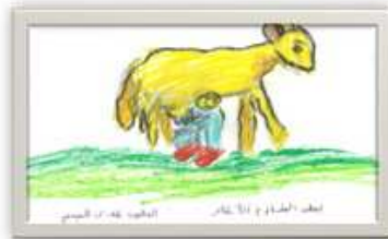
رشيد إبراهيم تيم ٨ سنوات شكل رقم ( ١٥ )