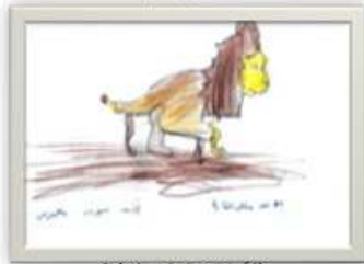
طارق إبراهيم الشاذلي ٨ سنوات شكل رقم ( ١٩ )