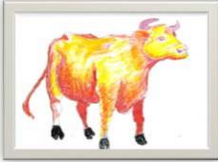
وسيط رقم ( ٦ )