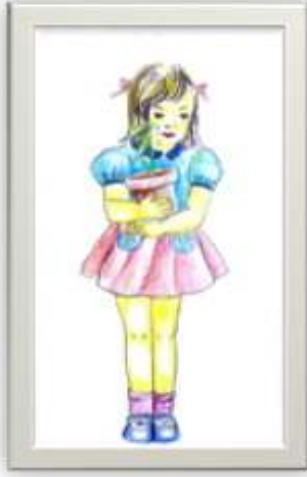
وسيط رقم ( ٢ )

الرسم من الطبيعة كمنطلق لتقديم وسائل فنية تساعد على تنمية قدرات الانتباه والفهم والتذكر لفئة بطيئي التعلم