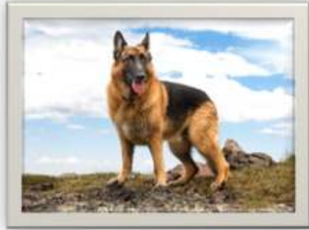
وسيط رقم ( ٥ )