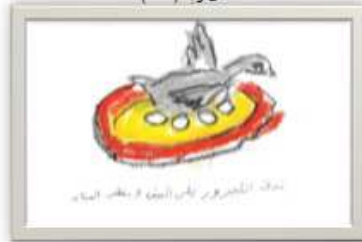
نور محمد حبيب ٨ سنوات شكل رقم ( ١٦ )