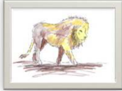
طارق ابراهيم السباعي ٨ سنوات شكل رقم ( ٩ )