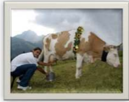
وسيط رقم ( ٧ )