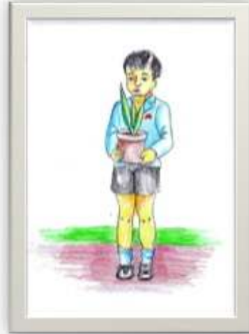
وسيط رقم ( ١ )