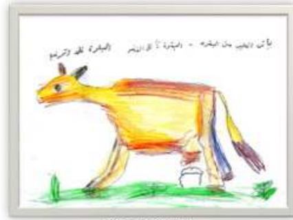
رويدا وليد مجاهد ٦ سنوات شكل رقم ( ٢٢ )