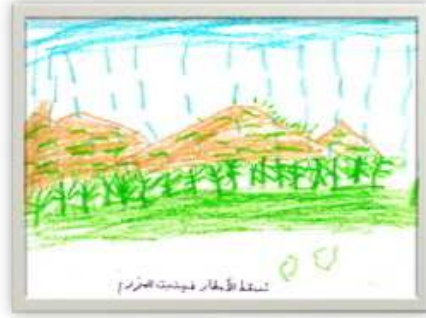
امير سيد احمد النجدي ٦ سنوات شكل رقم ( ٢١ )